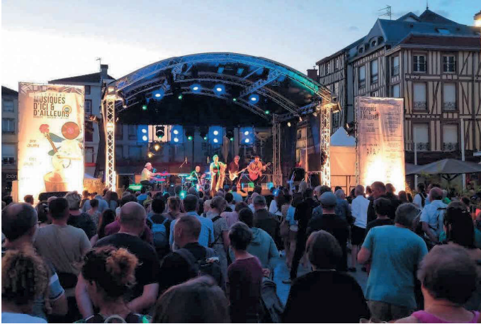
Chaque été, les concerts des MIA brassent les publics et les univers artistiques à Châlons et ailleurs.

Récemment présentée par l'association Musiques sur la ville, la 33e édition des Musiques d'ici et d'ailleurs (MIA) réunira 33 concerts à Châlons et dans les communes alentour cet été. Un temps envisagé du côté de Fagnières, l'événement Feminista est finalement annulé.