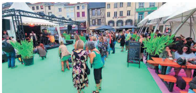
En configuration « terrasse », la grande scène laisse place à une plus petite installation mais plus proche des tables couvertes. - Musiques d'ici et d'ailleurs

Piétonnisée de moitié avec un parking réduit pendant les cinq semaines du festival, la place de la République ( https://www.lunion.fr/id508168/article/2023-08-02/une-place-de-la-republique-animee-mais-decritee-par-moments-chalons-en-champagne ) a accueilli une large programmation d'artistes internationaux, français et régionaux. Et près de 20 000 personnes selon un décompte approximatif de l'organisation. Cette configuration, « a minima », a été proposée à la Ville jusqu'en 2026 et les élections municipales. « Nous avons été heureux d'habiter cette place 7 comme nous souhaitons le faire depuis trois ans avec une qualité globale d'accueil et de prestation pour les équipes, les artistes et le