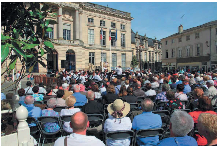
Les Musiques du dimanche attirent chaque année de nombreux mélomanes place Foch.

D'aucuns se demandaient déjà, lorsqu'elles ont célébré leur 20e anniversaire, quel était le secret de longévité des Musiques du dimanche, festival porté par l'association Musiques sur la ville, à Châlons. Voici déjà 30 ans qu'elles rayonnent au centre-ville et cette nouvelle édition réunira encore les ingrédients qui en font le succès : des concerts inédits en accès libre, des répertoires classiques comme contemporains pour parler à toutes les générations, et des ensembles musicaux amateurs de qualité, dont les membres, là aussi toutes générations confondues, partagent la même passion pour leur pratique.