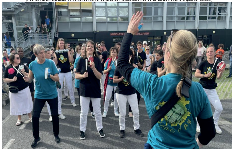
Les Ritmistas seront de la partie au cours de cette semaine.

(/id540772/article/2023-11-18/le-festival-rencontres-du-monde-aura-lieu-du-20-au-25-novembre-quartier-schmit)