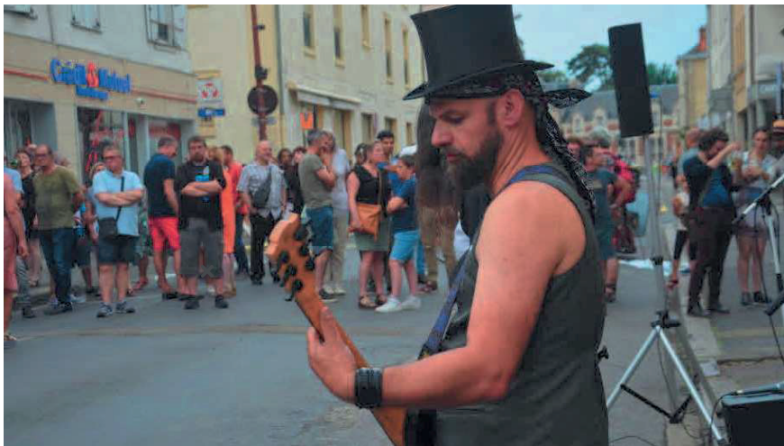
Comme l'an dernier, musiciens, danseurs et chanteurs vont proposer sons et chorégraphies sur la voie publique.

Artistes amateurs ou professionnels, en groupe ou en solo, danseurs, musiciens ou chanteurs ont jusqu'à ce lundi 3 juin pour s'inscrire sur le site internet de Musiques sur la ville ( musiquessurlaville.com ).