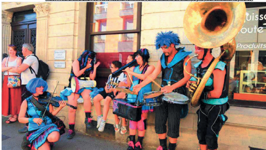
L'ambiance était rythmée et colorée lors de l'édition 2023.

(id577703/article/2024-03-10/le-festival-feminista-quitte-chalons-en-champagne-pour-sinstaller-fagnieres)