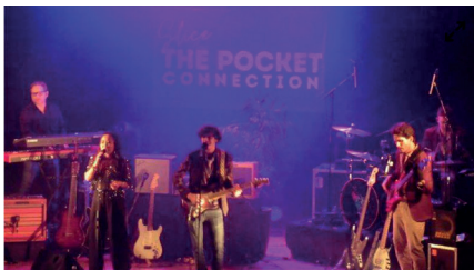
Slice and the pocket connection a pris la suite du concert.

C'est ce vendredi 23 février, dans la salle André Gallois, que s'est déroulée la 21 e nuit du blues organisée par Musiques sur la Ville.