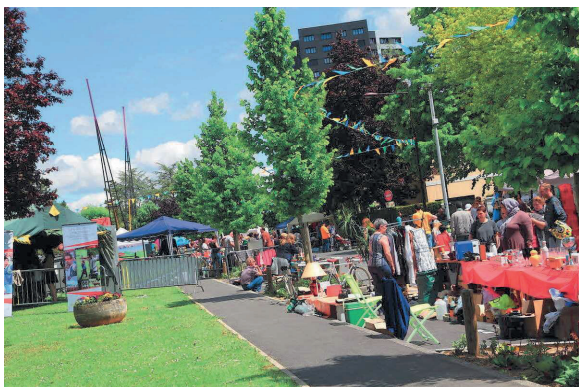
Vallée Saint-Pierre et le Verbeau accueilleront deux rendez-vous socio-culturel ce vendredi.

Deux rendez-vous festifs s'installent aux quartiers du Verbeau et de la Vallée Saint-Pierre ce vendredi 13 septembre. Au menu : concerts, spectacles, dégustation de frites et initiatives solidaires.