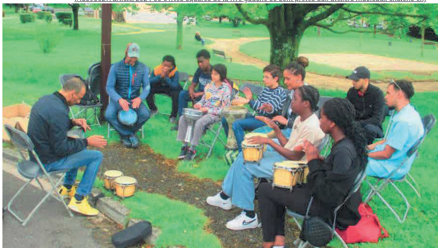
Une initiation champêtre a eu lieu, en début de semaine, pour préparer le festival de percussions du monde. Ici, au square de la rue de Cancale.

(/id595627/article/2024-05-01/les-squares-de-la-rive-gauche-se-sont-pretres-aux-ateliers-musicaux-chalons-en)