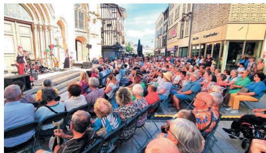
Le parvis de l'église Saint-Alpin accueille les concerts du dimanche. - Musiques d'ici et d'ailleurs

Par Alexis Bouzin Publié: 30 juillet 2024 à 18h00