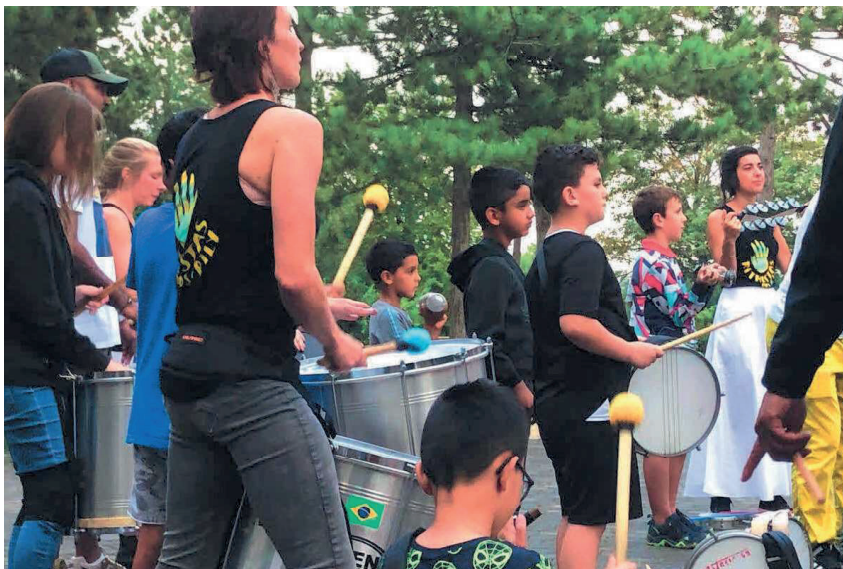
La Rive gauche vivra au rythme de l'Orient et des percussions, ce samedi.

Pour la 7 e année déjà, le Festival des percussions du monde, orchestré par le centre socio-culturel de la Rive gauche et l'association Musiques sur la ville, s'installera ce samedi dans le quartier. Sa vocation : rendre accessibles au plus grand nombre les instruments, les rythmes et l'ambiance incomparable des concerts de partenaires. Comme tous les ans, une multitude de partenaires, mais également les habitants, entrent dans la danse, bien en amont du festival puis le jour J. Destination choisie pour cette édition : l'Orient.