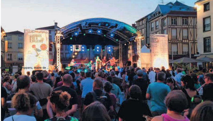
La foule s'était rassemblée sur la place de la République, l'an dernier, pour le concert de Kaz Hawkins.

/id603375/article/2024-05-24/les-musiques-d-ici-et-d-ailleurs-se-veulent-festives-et-familiales-chalons