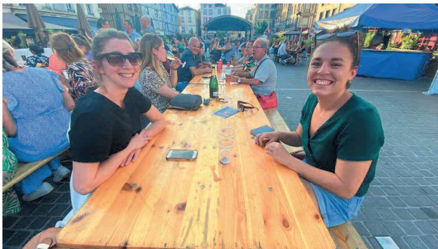
Les grandes tablées permettent à chacun de s'installer à son aise.

L'événement de la Place de la République revient ce 18 juillet. Le prochain aura lieu le 8 août prochain.